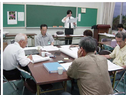
全体でのやりとり