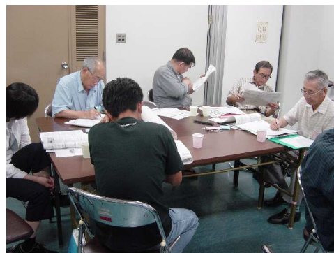
全体でのやりとり