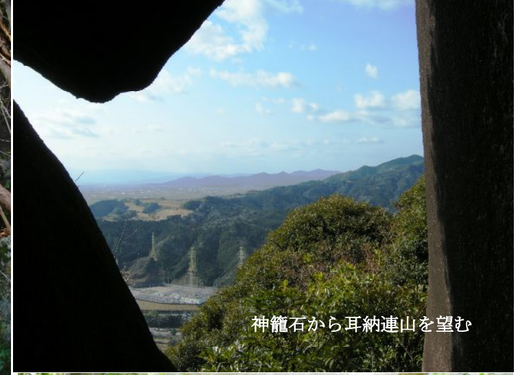
神籠石から耳納連山を望む