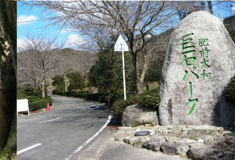
肥前大和 巨石パーク