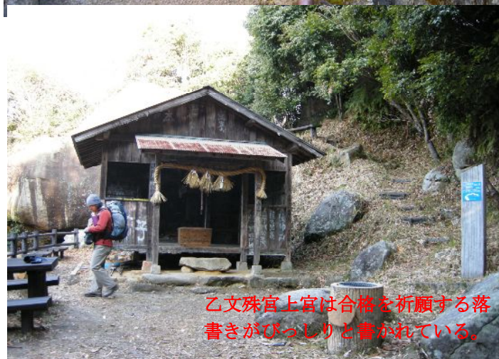
乙文殊宮上宮は合格を祈願する落書きがびっしりと書かれている。