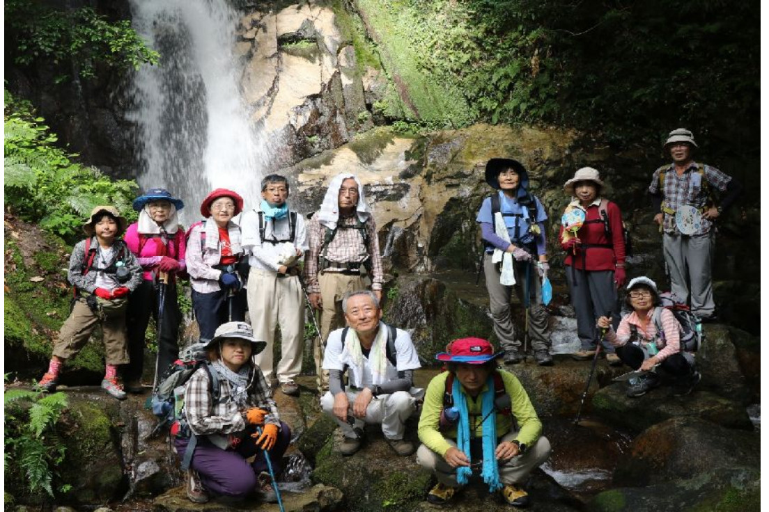
←滝の左手の13仏の前を通り登山道に取りつく ↑第一の滝