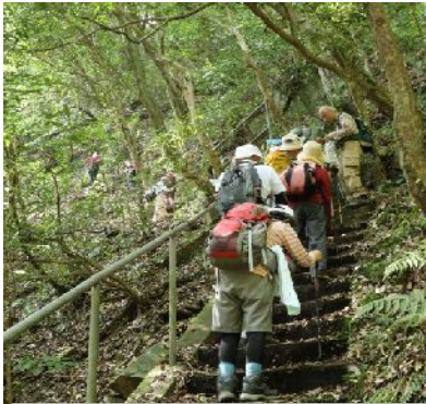
↑滝の左手を巻いて登る