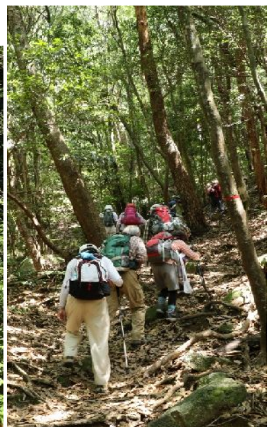
山頂までの登りは意外に長い