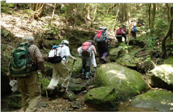
↑渡渉点を渡り大岩を右手に見て登る