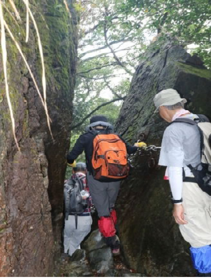
←ハサミ岩を通過 ↓奥ノ院で安全祈願