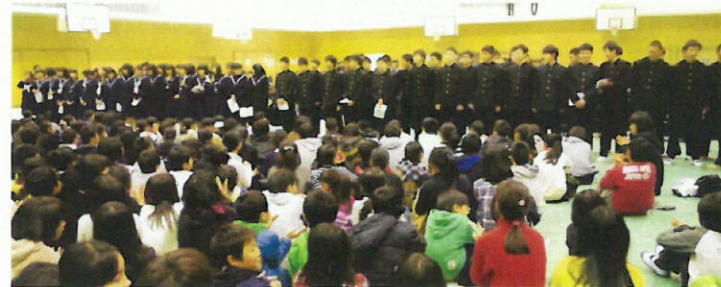
(会場) 日の里中学校体育館 14:00~