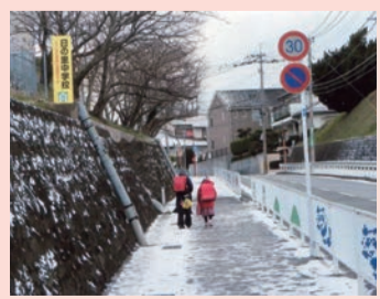
日の里中学校横のバス通り。小中学生は10時頃登校

山を参加者5人で実施しました。本年は天候も良く多数の登山者で山頂付近は大盛況でした。今年は鮮明なご来光を拝むことができたこと、3年ぶりのご来光でした。今年も良き年であります様に祈願し下山しました。