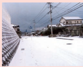
翌25日の9丁目バス停で一面の銀世界、積雪5cm。