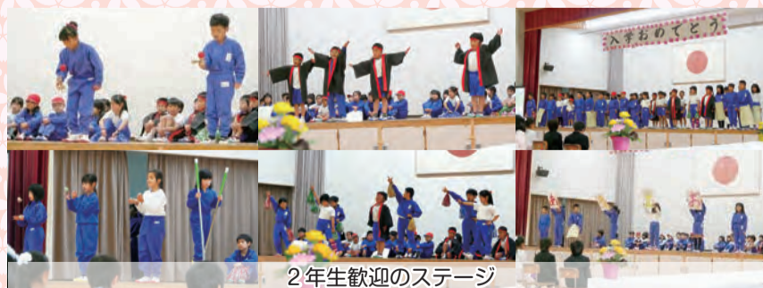
2年生歓迎のステージ