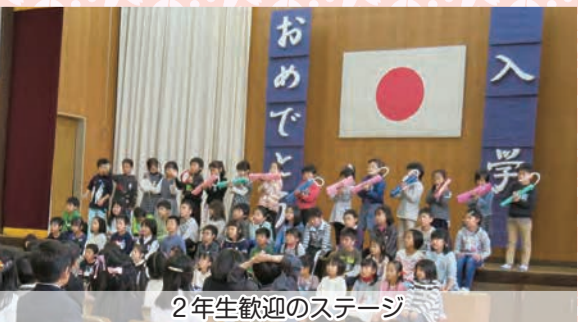
2年生歓迎のステージ