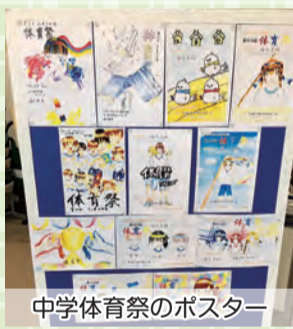
中学体育祭のポスター