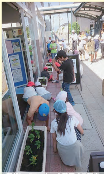
駅前にプランターを設置する児童

これから2か月後、日の里まつりが開催される時には、マリーゴールドなどの花々がきれいに咲き誇っていることでしょう。