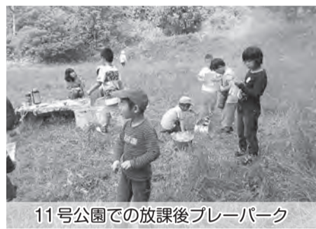
11号公園での放課後プレーパーク

第1火曜日は日の里4号公園、第4火曜日は日の里11号公園で放課後プレーパークを15時〜17時に開催しています。(学校が休みの時はプレーパークも休み)プレーパークとは、自分の責任で自由に遊