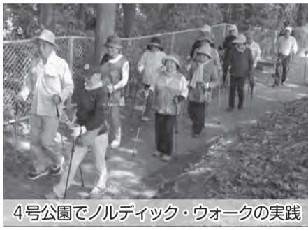
4号公園でノルディック・ウォークの実践

今年度の事業計画に「ノルディック・ウォーク」を掲げ、市が指導している「ルックルック講座」を活用、早速4月26日に4丁目公民館で講習と実践を実施しました。28人が参加し、講師からDVDで基本練習を受けた後、4号公園で実践を開始。参加した多くの方から好評を得て、継続の要望が多いことから、毎週火曜日の午前8時30分から1時間、木立の